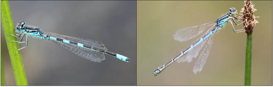
Abb. 1: Männchen (links) und Weibchen (rechts) von Coenagrion scitulum an der westlichen Flutmulde bei Riegel; 26.07.2013